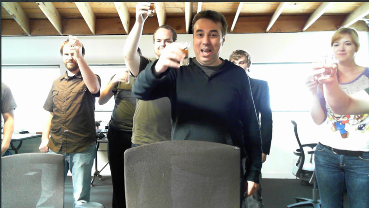
(Screenshot aus der Verabschiedung der Fans zum Ende des 24-Stunden-Livestream)

Er gibt noch den Hinweis dass es am Monat nochmal ein Schwung Informationen geben wird. So soll es neben einem neuen Video zur Entstehung der Origin 300i, einen ausführlichen Einblick in die Wirtschaft des Spiels geben. https://robertsspaceindustries.com/comm-link/transmission/13120-Letter-From-The-Chairman